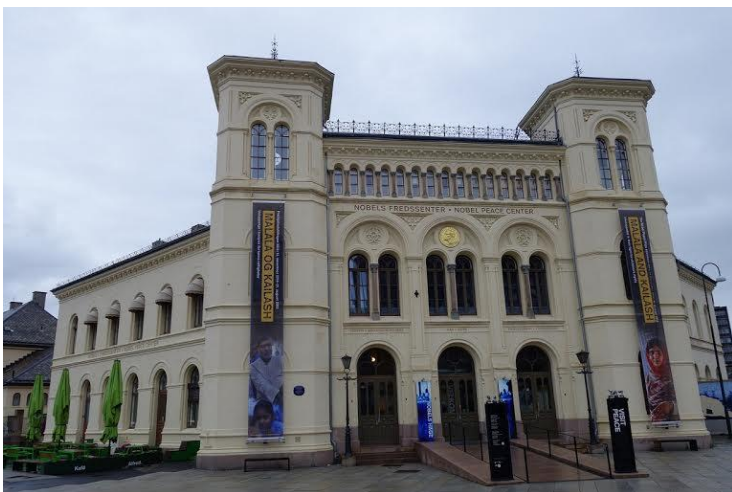
Centrul Nobel pentru Pace din Oslo

Premiul Nobel pentru Pace este unul din cele cinci premii „Nobel“ instituite prin testament de inventatorul și industriașul suedez Alfred Nobel. Este singurul premiu care se decernează în Norvegia, la Oslo, în cazul asociației s-a făcut la 11 decembrie 1985, prestigioasei activități desfășurate de IPPNW .