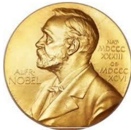
Medalia Premiului Nobel